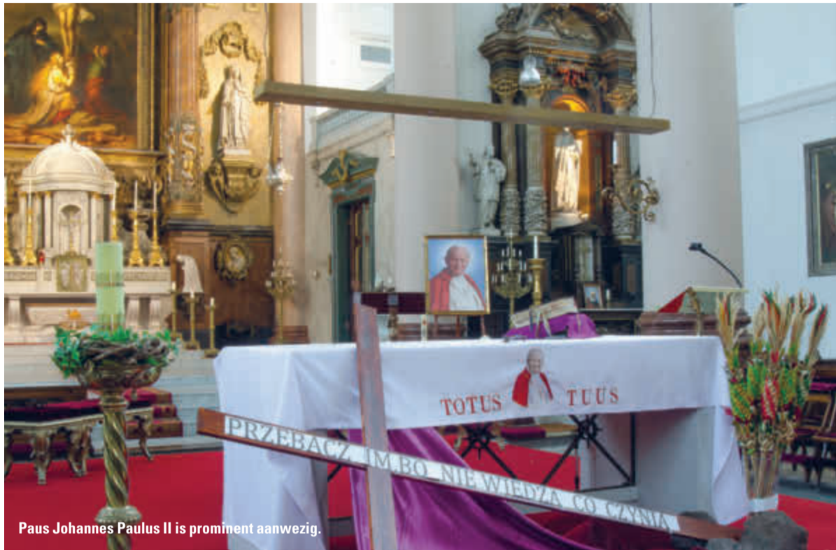
Paus Johannes Paulus II is prominent aanwezig.

Wat is nu de link met de Teresiakerk? Nog even een stukje geschiedenis. In 1648 werd de Vrede van Munster gesloten, waarbij de opstandige Nederlanden een zelfstandige staat werden. Daaruit vloeide voort dat er ambassades naar Den Haag kwamen, waaronder de Spaanse. De Spaanse gezant vestigde zich aan het Westeinde. In zijn kielzog kwam een aalmoezener mee, een jezuïet; de orde van de jezuïeten heeft zijn oorsprong in Spanje.