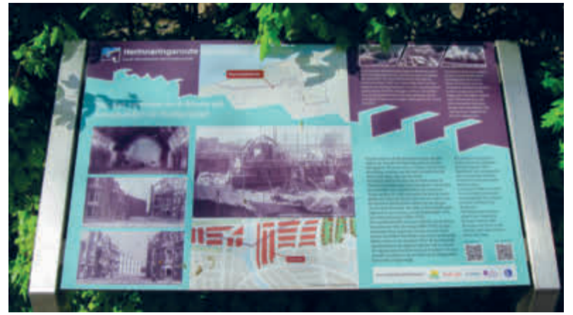
De kerk ligt op de fietsroute die herinnert aan de Atlantikwall.

Drie Haagse kerken: de Grote Kerk, de Teresiakerk en deze noodkerk: wat een verhalen vertellen ze over de geschiedenis van Den Haag, stad van vrede en recht. En over de historie van Europa. Wie langs deze drie kerken wandelt, voelt de geschiedenis. (mcb)