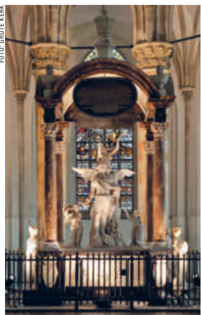
Monument voor Van Wassenaer Obdam.

rondleider in de Grote Kerk, staat naast me en zegt: 'Ik ben dat monument steeds gekker gaan vinden. Vroeger was daar het hoogaltaar, de focus van het kerkgebouw. Het hele ontwerp is gericht op de tafel van samen eten en delen. In bijna elke Nederlandse grote binnenstadskerk is na de beeldenstorm op die plek bewust een monu-