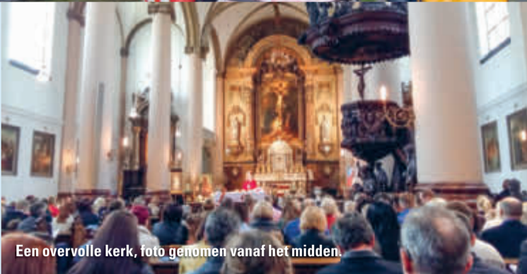
Een overvolle kerk, foto genomen vanaf het midden.