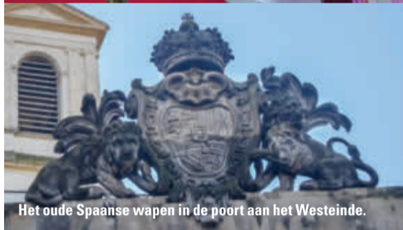
Het oude Spaanse wapen in de poort aan het Westeinde.