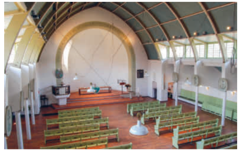
Het dak lijkt te zweven, een vondst van Otto Bartning.