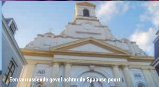
Een verrassende gevel achter de Spaanse poort.

Er kwam een rooms-katholieke kapel, zoals dat in ambassades van rooms-katholieke landen gebruikelijk was. Haagse katholieken konden nu ter kerke gaan in het Westeinde, hoewel de Staten hadden verboden niet-huisgenoten van ambassadebewoners toe te laten in hun kapel. In 1677 verhuisde de ambassade naar een groot pand aan de overkant van het Westeinde, het aloude