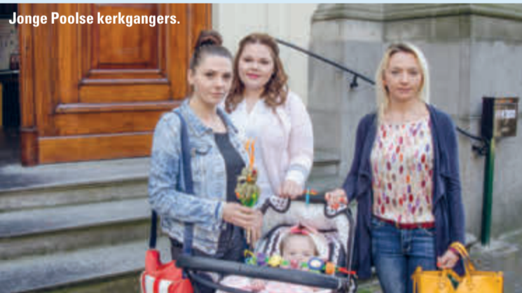
Jonge Poolse kerkgangers.