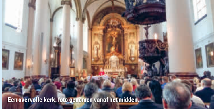
Een overvolle kerk, foto genomen vanaf het midden.