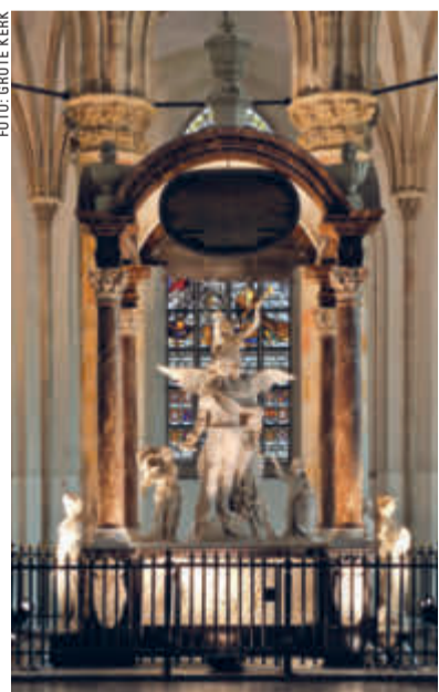
Monument voor Van Wassenaer Obdam.

rondleider in de Grote Kerk, staat naast me en zegt: 'Ik ben dat monument steeds gekker gaan vinden. Vroeger was daar het hoogaltaar, de focus van het kerkgebouw. Het hele ontwerp is gericht op de tafel van samen eten en delen. In bijna elke Nederlandse grote binnenstadskerk is na de beeldenstorm op die plek bewust een monu-