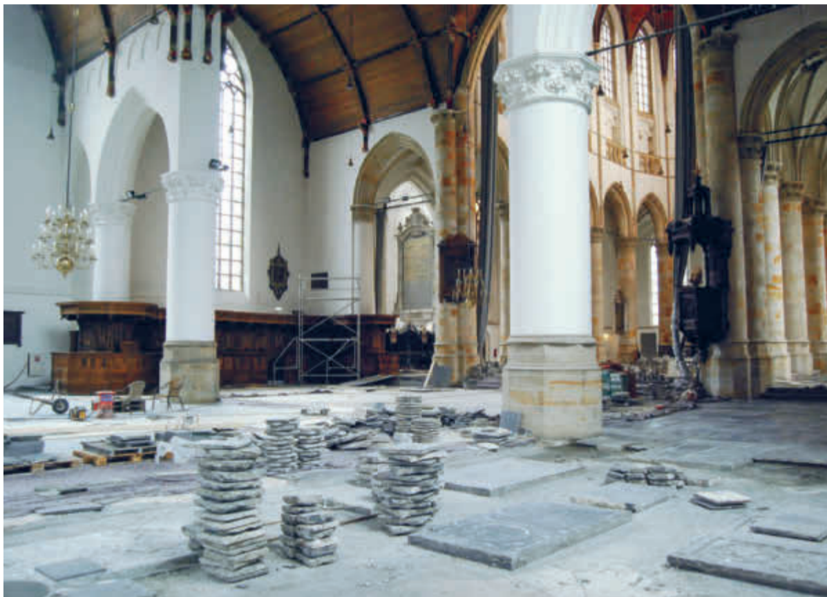
De geschiedenis van de Grote Kerk gaat door; de restauratie van 2007.

Ontstaan als houten kapelletje in de dertiende eeuw is de Grote Kerk in de loop van de tijd uitgegroeid tot een imposante ruimte, boordevol herinneringen.