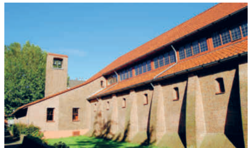
Een markant gebouw midden in een Haagse wijk.