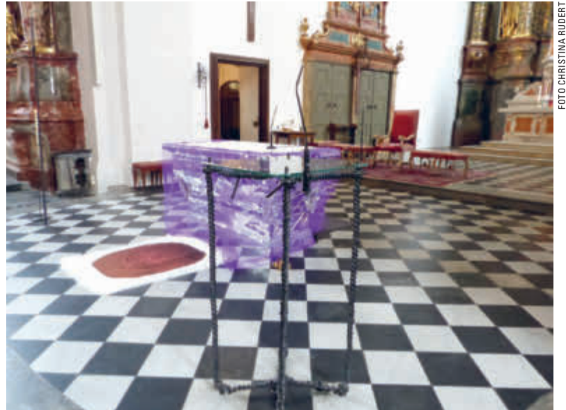
Een kleurige altaartafel in de St. Andräkirche in Graz.

Alle partners hebben van 4 tot 7 mei 2017 Den Haag bezocht. Kerk in Den Haag heeft toen haar 'leermodule' gepresenteerd in de vorm van deze bijlage van het maandblad. Ook zijn de drie betrokken kerken bezocht. (pg)