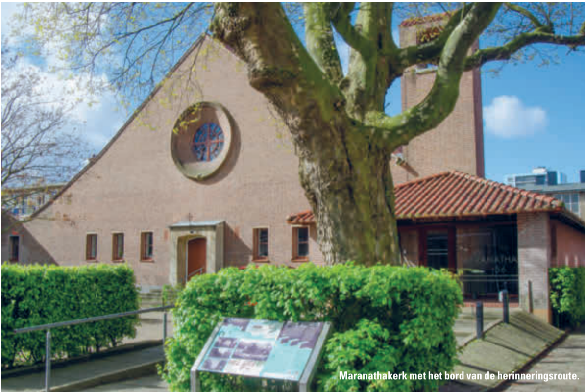
Maranathakerk met het bord van de herinneringsroute.