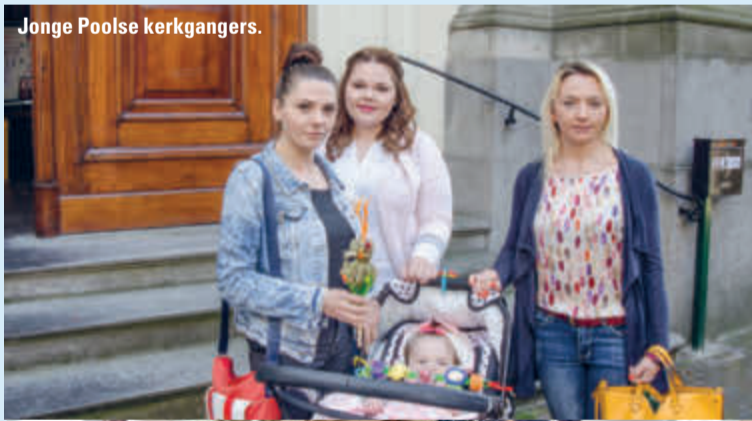
Jonge Poolse kerkgangers.