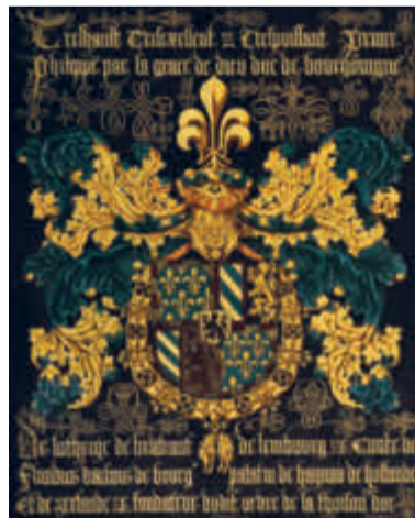
Een van de ridderborden uit 1456.